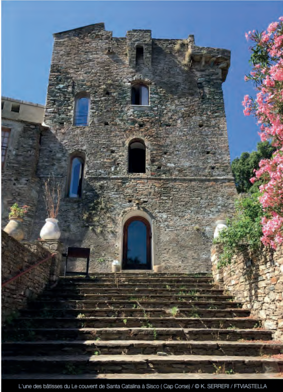
L'une des bâtisses du Le couvent de Santa Catalina à Sisco ( Cap Corse)