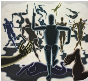
Victor Vasarely, Abstracción en movimiento - Estudio del documento (El Nacimiento) , 1963 Óleo sobre lienzo, Study of Motion (The Birth) Tempera sobre cartónpapel, 117 x 132 cm Museo Nacional Thyssen-Bornemisza, Madrid © Victor Vasarely, VICOP, Madrid, 2018

Obra de Victor Vasarely (Pécs, 1906 - París, 1997), padre del movimiento Op Art