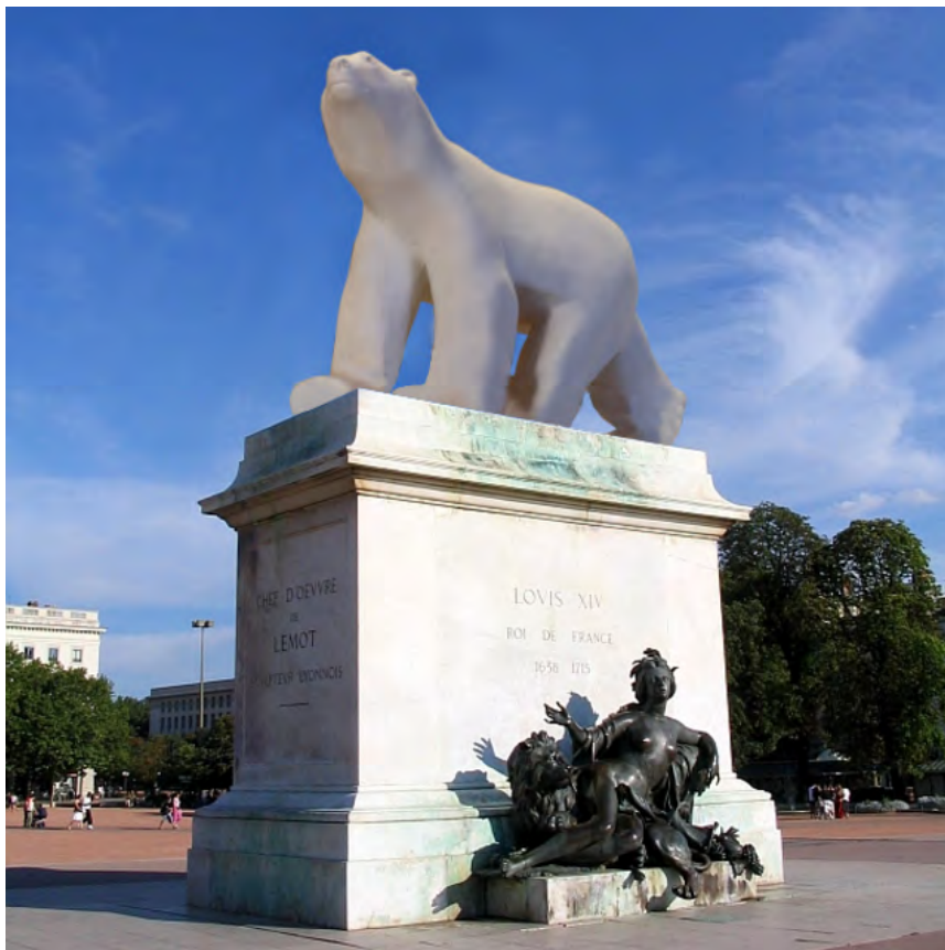
L'ours de Pompon sur la Place Bellecour - montage photo réalisé par Mégane Rabu, Johanna Raimbault, Fanny Silou, Loïc Serfass, étudiants à l'ENSAL, pour l'édition 2018 Nuit des Musées © DR