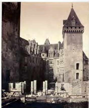
Tant d'histoires ont émaillé le château de Pau, la première mention connue de l'édifice remonte au XIIe siècle, © Château de Pau

démêler le vrai du faux. Cette nuit, tout est permis !