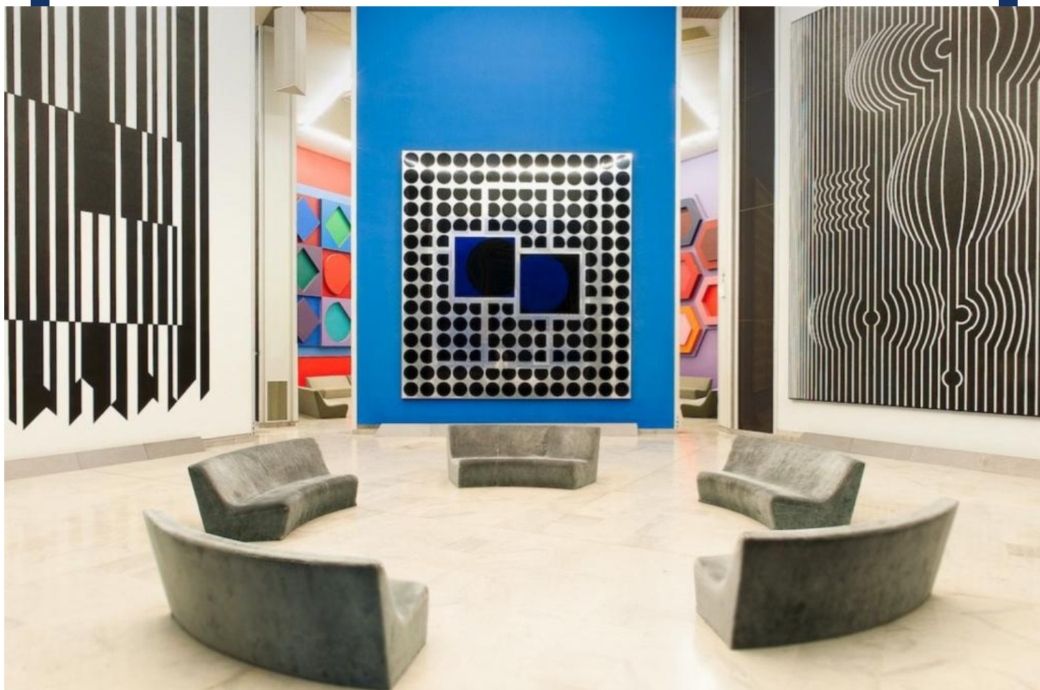
Une des salles hexagonales d'exposition réaménagée.